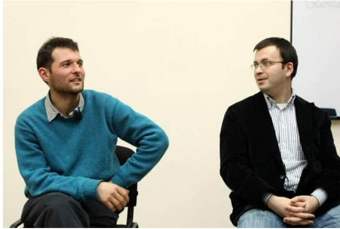
Adnan Hacıadə (1983) Azərbaycanlı fəal və dissident