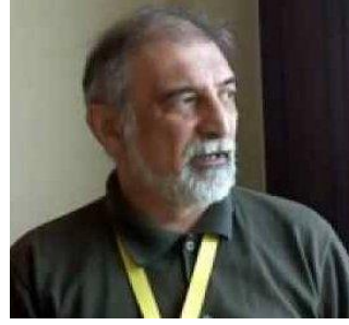
Hikmət Hacıadə (1954) Müstəqil Azərbaycanın Moskvadakı ilk səfiri, liberal siyasi şərhçi