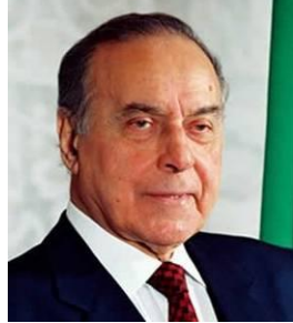
Heydər Əliyev (1923-2003) Azərbaycanın ikinci seçilmiş prezidenti (1993-2003)