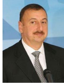
İlham Əliyev (1961) Azərbaycanın üçüncü seçilmiş prezidenti (2003-cü ildən bu günə qədər)