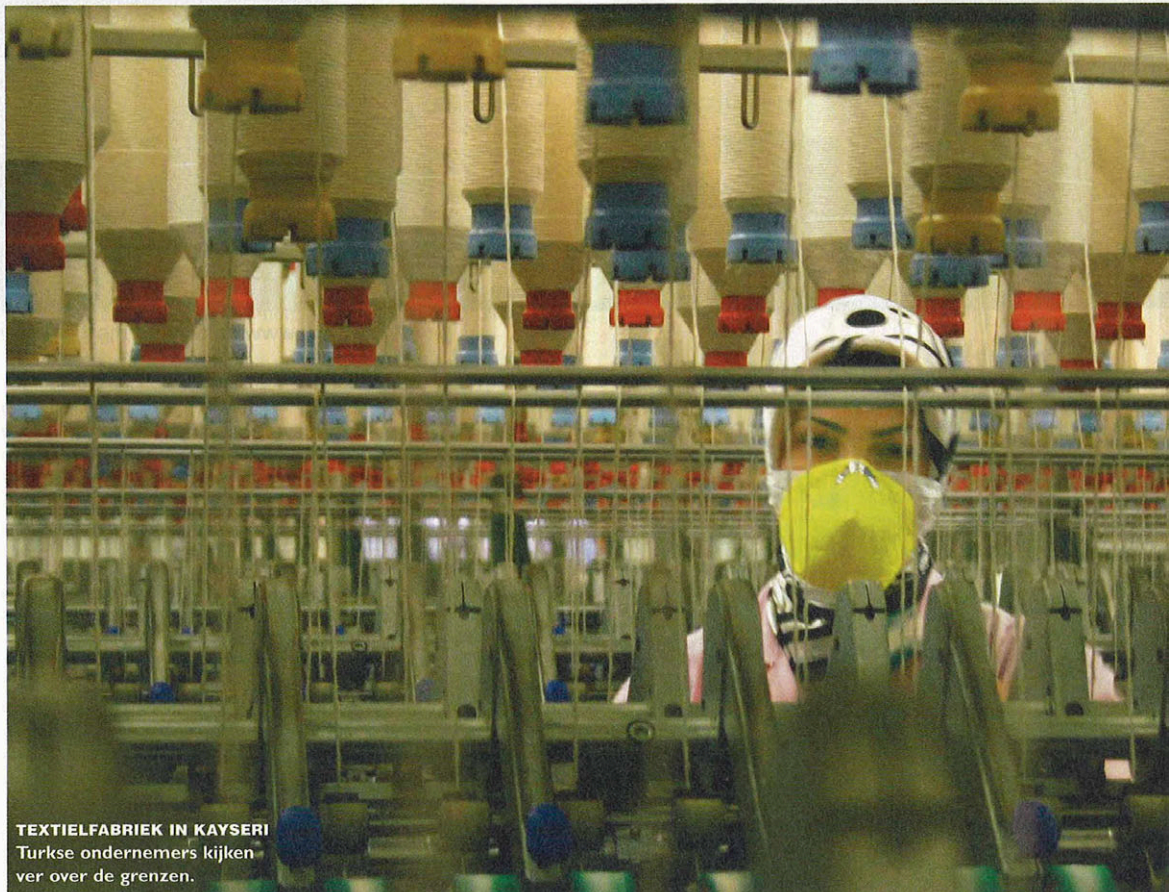
TEXTIELFABRIEK IN KAYSERI Turkse ondernemers kijken ver over de grenzen.